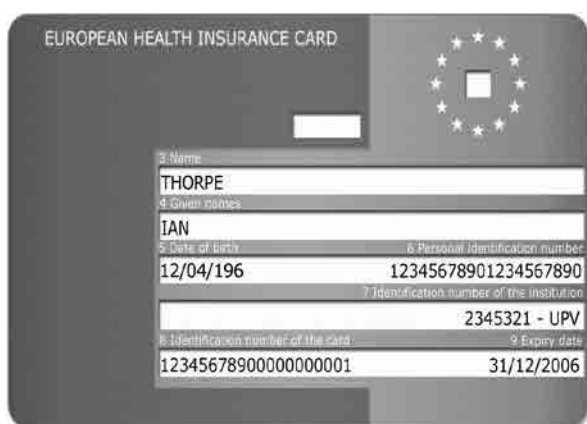
Carte européenne d'assurance maladie.

Les personnes qui tombent malades lors d'un séjour temporaire dans un Etat membre de l'UE ou de l'AELE peuvent se faire soigner sur place. L'assuré a droit à toutes les prestations en nature qui s'avèrent médicalement nécessaires lors de son séjour sur le territoire d'un autre Etat, compte tenu de la nature des prestations et de la durée dudit séjour. En d'autres termes, le patient a droit à tous les soins que son état de santé nécessite pour lui permettre de continuer son séjour dans des conditions médicalement sûres ; il ne doit pas être contraint de rentrer dans son Etat de résidence pour se faire soigner. A cet effet, il doit se procurer une carte européenne d'assurance maladie (ou un certificat provisoire de remplacement) auprès de son assureur suisse et la présenter au prestataire de soins ou à l'institution de l'Etat d'accueil.